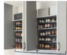
hapia / 玄関収納 開き戸ユニット [DAIKEN]