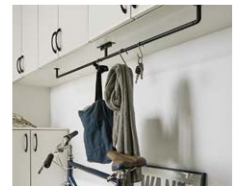
住まいにあわせて拡張できる 収納ユニット・パピア