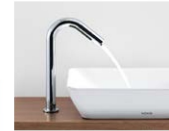
自動水栓・電気温水器※1