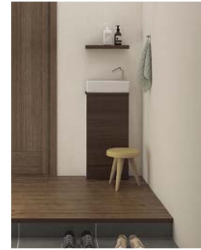
レストルームドレッサー コンフォートシリーズ [TOTO]