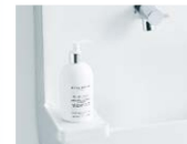
ハンドソープ置き※2